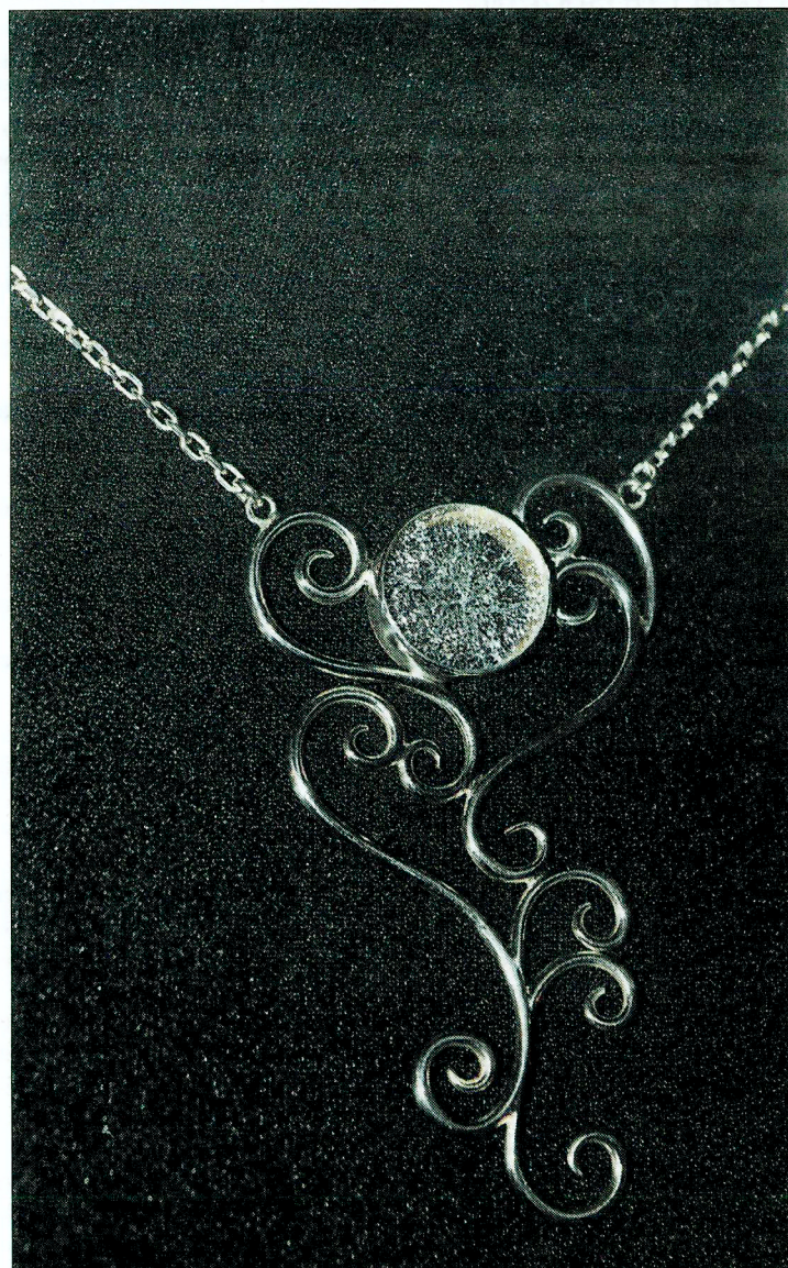
TR1:n näyttelyssä selkäriipuksen etupuolella on tasapainottajana lasilla koristettu riipus dekoltepuolella.

KORU – Pirkanmaa muotoilee V -näyttely TR1 Taidehallissa (Väinö Linnan aukio 13, Tampere) 16. marraskuuta saakka.